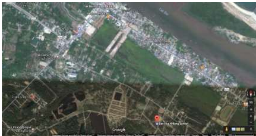
แผนที่โรงเรียนบ้านหัวคลอง