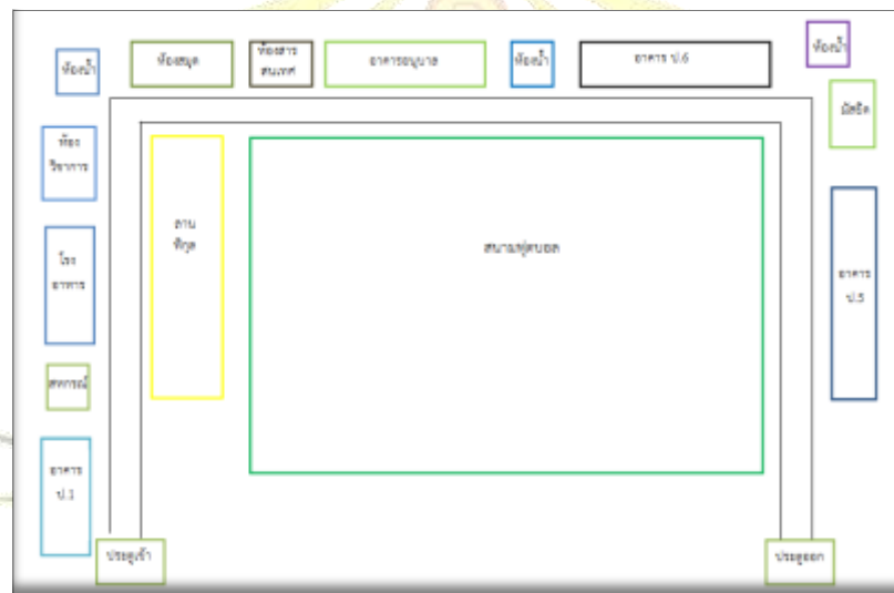
แผนผังโรงเรียนบ้านหัวคลอง